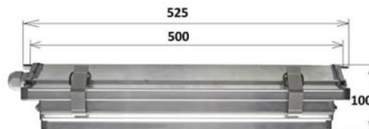
Maximi leveys 250